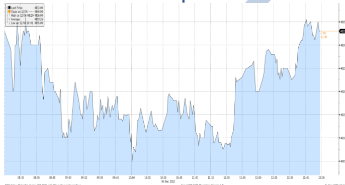
Gráfica 2. Precios de Cotización Intradía del dólar Spot