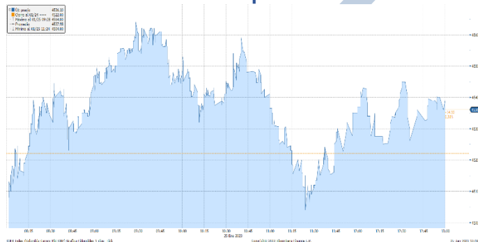
Gráfica 2. Precios de Cotización Intradía del dólar Spot