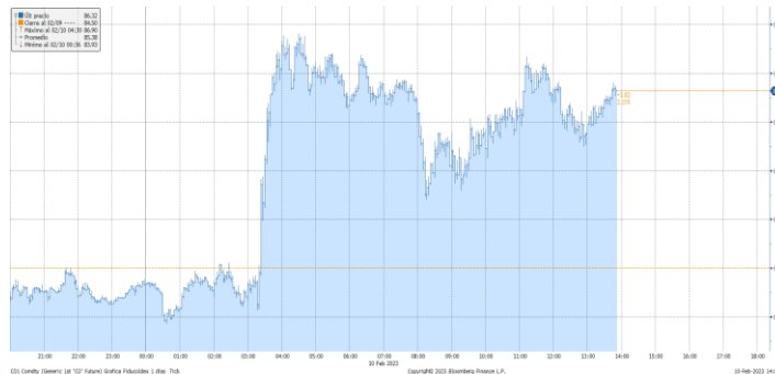
Gráfica 1. Precios de negociación de Petróleo Brent