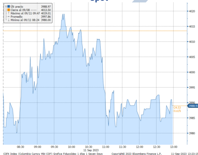
Gráfica 2. Precios de Cotización Intradía del dólar Spot