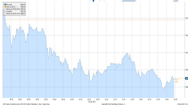
Gráfica 2. Precios de Cotización Intradía del dólar Spot